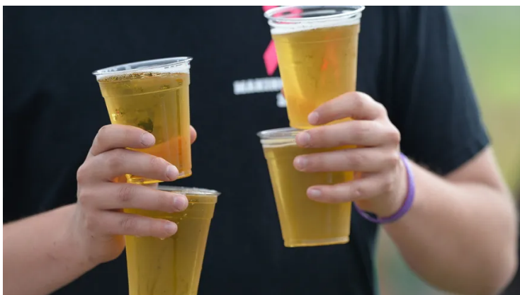
Les clubs pourraient être autorisés à vendre de l'alcool lors de 10 matchs par an

Plus de 70 députés LREM ont déposé fin juillet une proposition de loi qui prévoit notamment d'autoriser à nouveau les clubs de football professionnels à vendre de l'alcool dans les stades. La question divise dans le Nord Franche-Comté.